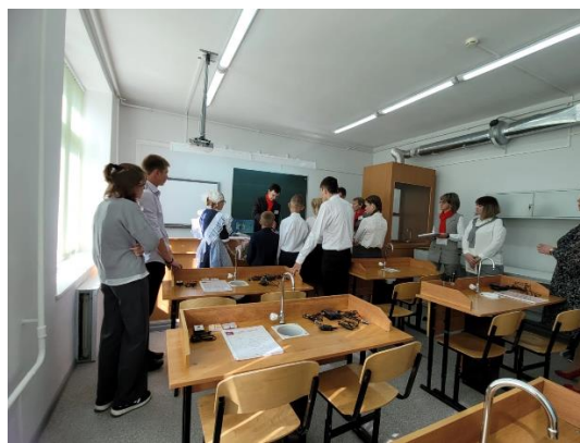
Работа с цифровой лабораторией центра «Точка роста» МОУ Талицкой СОШ

В рамках регионального проекта "Цифровая образовательная среда" НП «Образование» МОУ Корежская СОШ обеспечена материально-технической базой для внедрения цифровой образовательной среды. В школу поступило современное цифровое оборудование для проведения уроков по физике, биологии, химии и технологии.