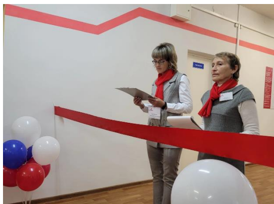
Открытие центра «Точка роста» МОУ Талицкой СОШ

В 2020 -2023 году в рамках регионального проекта "Современная школа" НП «Образование» были реализованы инфраструктурные мероприятия по созданию и обеспечению функционирования центров "Точка роста". Всего в Буйском муниципальном районе на базе школ создано 5 «Точек роста». В 2023 году создан центр образования естественнонаучной и технологической направленности «Точка роста» на базе МОУ Талицкой СОШ.